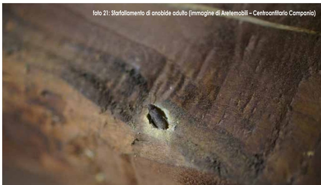
foto 21: Sfarfallamento di anobide adulto