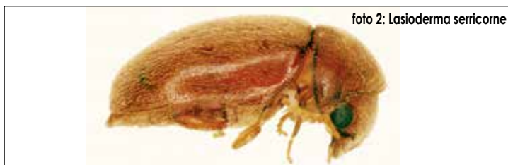
foto 2: Lasioderma serricorne